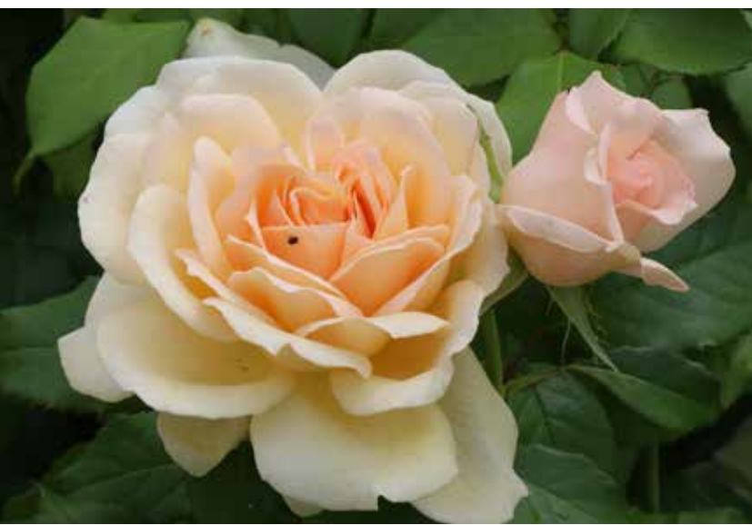
◀ Rosier Sweet Love, Harkness 2005 et Rosier Jubilé du Prince de Monaco, Meilland 2000